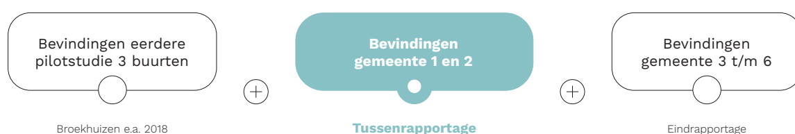
Figuur 1.1 Grafische weergave stapeling kennis meldingsbereidheid ondermijnende criminaliteit

De interventies die we binnen dit project evalueren variëren in inhoud (type interventie), locatie (verschillende gemeenten), reikwijdte (aantal deelnemers) en doelgroep. Om deze interventies in samenhang te kunnen analyseren, ontwikkelen we een onderzoeksmethodiek die voor verschillende interventies in de zes onderzoeksgemeenten te gebruiken is. 2 Resultaten kunnen door de vergelijkbare onderzoeksmethodiek samengevoegd worden waardoor (vanwege de grotere onderzoeksgroep) verdiepende analyses uitgevoerd kunnen worden. Het toepassen van een vergelijkbare methodiek maakt het daarnaast mogelijk om de resultaten van verschillende interventies te vergelijken. We bouwen met de evaluaties in het huidige project ook voort op bevindingen uit de eerdere pilotstudie (Broekhuizen e.a. 2018 3 ). Figuur 1.1 geeft de kennisstapeling die hierdoor ontstaat weer.